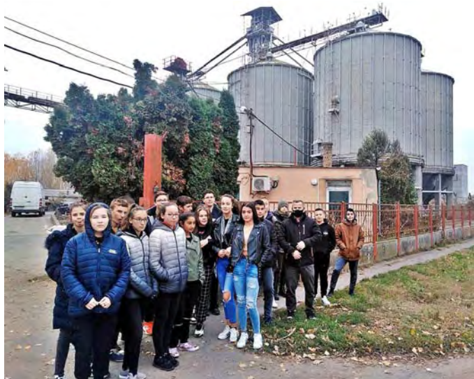
Felső tanulóink a malomüzem silói előtt

November 2-án a pályaválasztás, a különböző szakmák megismerése kapott főszerepet iskolánkban. A pályaeorientációs nap célja az volt, hogy ne csak 7-8. osztályra korlátozódjon tanulóink életre való felkészítése, hanem folyamatosan, minden osztályban életkorhoz megfelelő formában segítsük diákjainkat életpályájuk megtervezéséhez.